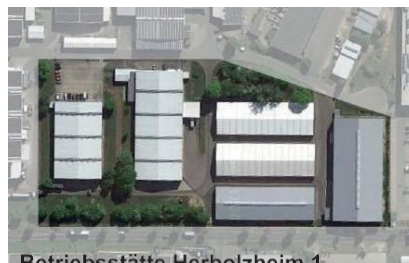
Betriebsstätte Herbolzheim 1

www.rodermund.de | bewerbung@rodermund.de