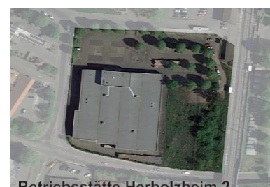
Betriebsstätte Herbolzheim 2